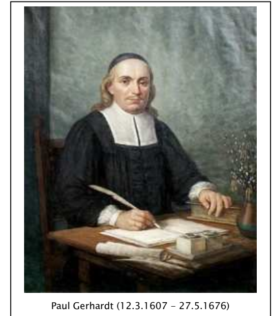
Paul Gerhardt (12.3.1607 – 27.5.1676)