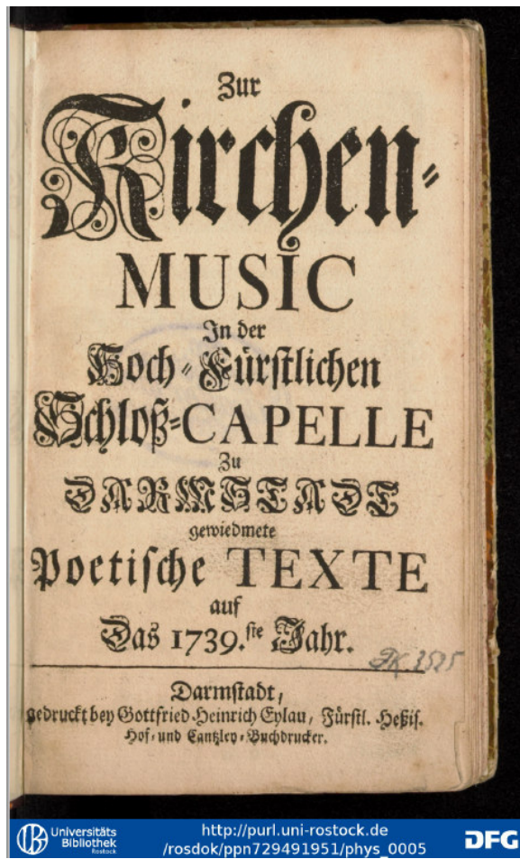
Lichtenberg 1738-1739 Titelseite